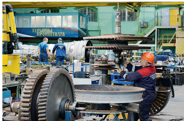
Турбинисты Кронштадта. Первые и единственные

Специалисты Кронштадтского морского завода научились продлевать жизнь газоперекачивающим агрегатам ГПА-10 и газотурбинным двигателям ДР59, отработавшим 125 000 часов. В цехе № 38 овладели технологией продления ресурса работы старого, но надёжного оборудования до 150 000 часов.