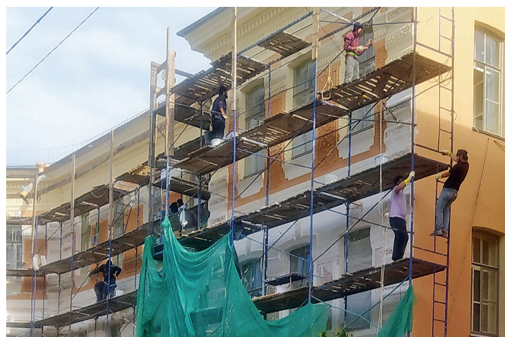
Фото Надежды Рыбаковой

Текст и фото: Евгения Киселёва, Анастасия Абрамова